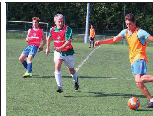
Sur le terrain, jeunes et moins jeunes ont tout donné.