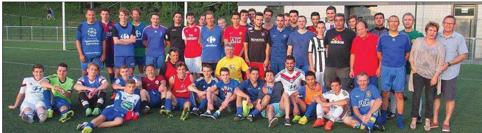
Une fin d'après-midi festive avant la remise des récompenses.

Pour fêter la fin de la saison officielle du Football club, un tournoi a réuni toutes les générations, enfants, adolescents et adultes, sur le même terrain. Samedi, plus d'une centaine de sportifs représentant des dizaines de clubs fictifs, tirés de la première ligue française, se sont ainsi affrontés, dans le plus grand respect et la plus parfaite convivialité, mais sans faire le moindre cadeau à l'équipe adverse.